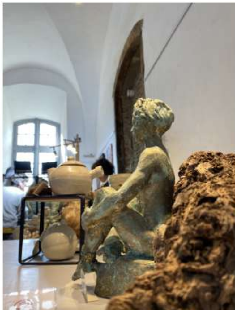
Les sculptures, les céramiques et le savoir-faire étaient au cœur de l'abbaye.

Il faut dire que l'organisation de ce Salon d'Artisanat d'Art dans un lieu aussi mythique que l'abbaye de Saint-Sever-de-Rustan était le mélange parfait entre les techniques artistiques et le patrimoine culturel. Il sera d'ailleurs bientôt possible d'effectuer de nouvelles visites dans ce monastère bénédictin datant du XI e siècle, puisqu'il rouvrira ses portes au mois de juin et ce jusqu'en septembre.