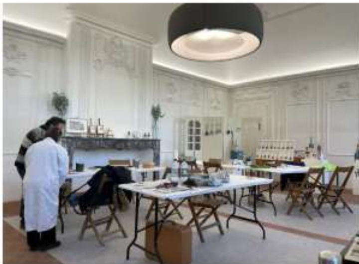
Les visiteurs plangent dans les coulisses du geste artisanal.

L'abbaye de Saint-Sever-de-Rustan a accueilli pour la deuxième fois le Salon d'Artisanat d'Art début avril. Les échanges entre le public et les artisans ont été productifs.